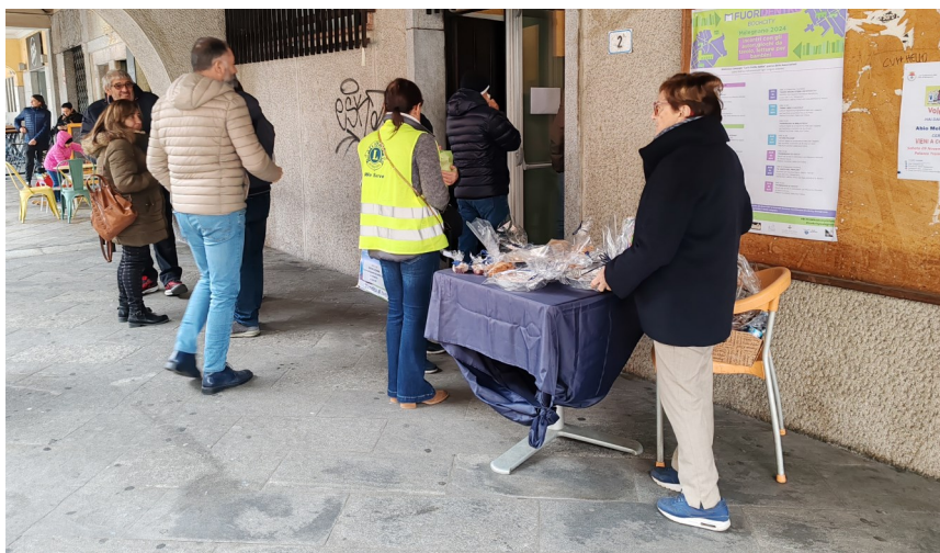
Fotocronaca della Giornata Mondiale del Diabete