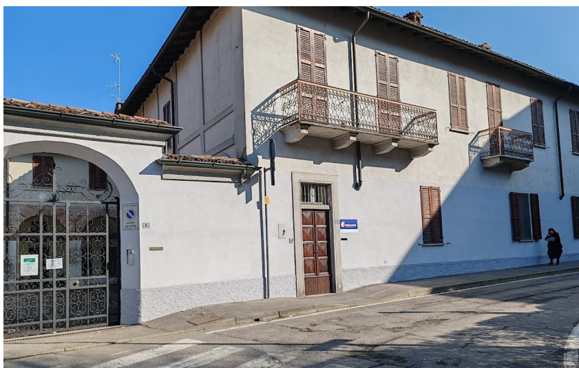
Sede dell'Emporio Solidale "San Pier Giorgio Frassati" in via D. Alighieri 6