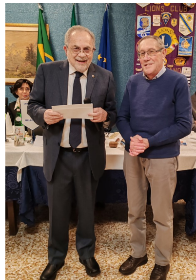
Un momento della consegna del contributo dei Lions Melegnanesi per il nuovo Emporio Solidale della Caritas cittadina

colto i fondi da devolvere. Già in passato i Lions di Melegnano hanno sostenuto il grande sforzo della Caritas impegnata nella realizzazione della "Casa di accoglienza" devolvendo l'inte-